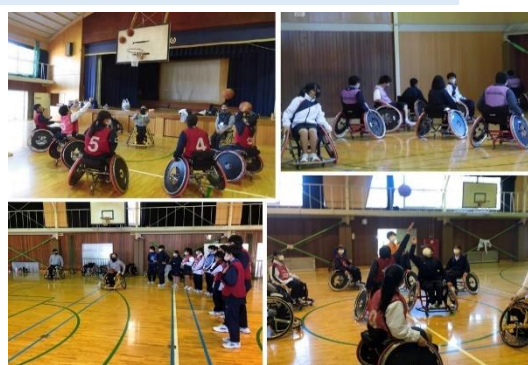
社会福祉協議会の方や選手と一緒に、 車いすバスケットボールを体験！

★新型コロナウイルス感染者は減少していましたが、最近、新たな変異株による感染拡大が心配されています。昨年以來、学校が長期休業を迎えると感染者が増加するパターンが続いているので、今後短期間で状況が変化することも考えられます。年末年始も、御家族みなで感染防止対策の徹底をお願いします。★