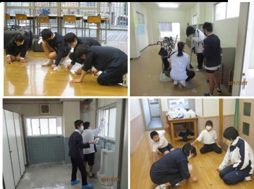
中学校の校舎を小6と中1・2が、 小学校の校舎を中3と小5が清掃活動！