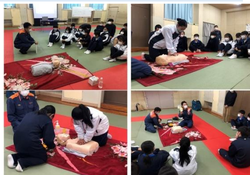
心臓マッサージとAEDの使い方を体験！