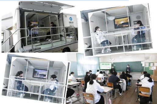
起震車で震度7を体験！